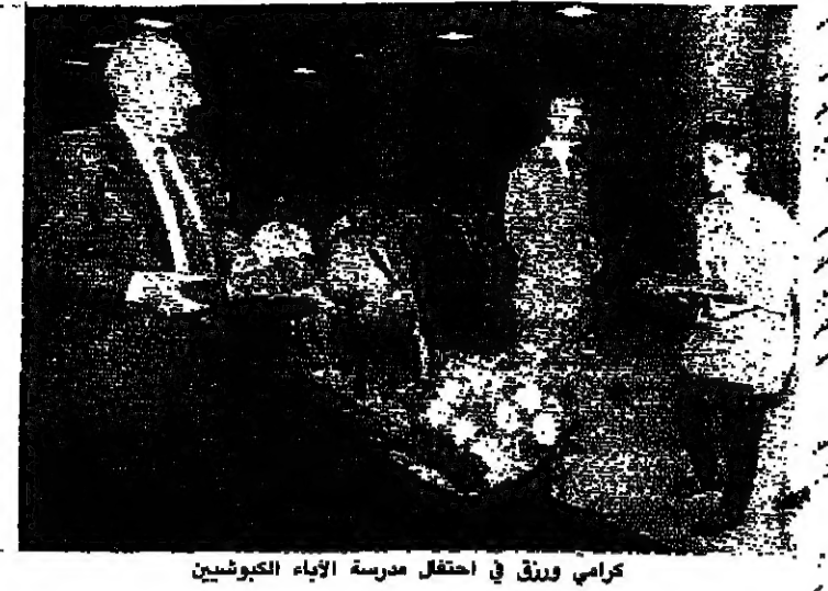
كرامي ورثق في احتفال مدرسة الآباء الكويشيين

قامت مدرسة الكويشيين حفل توعية جوائز على طلاب الصفوف العليا حضره الوزيران عمر كرامي وادوم رثق، النائب زكي مزويدي، محافظ بيروت المهندس جورج سمحة، قنصل عام فرنسا ومجموعة من الاساتذة والشخصيات الامم.